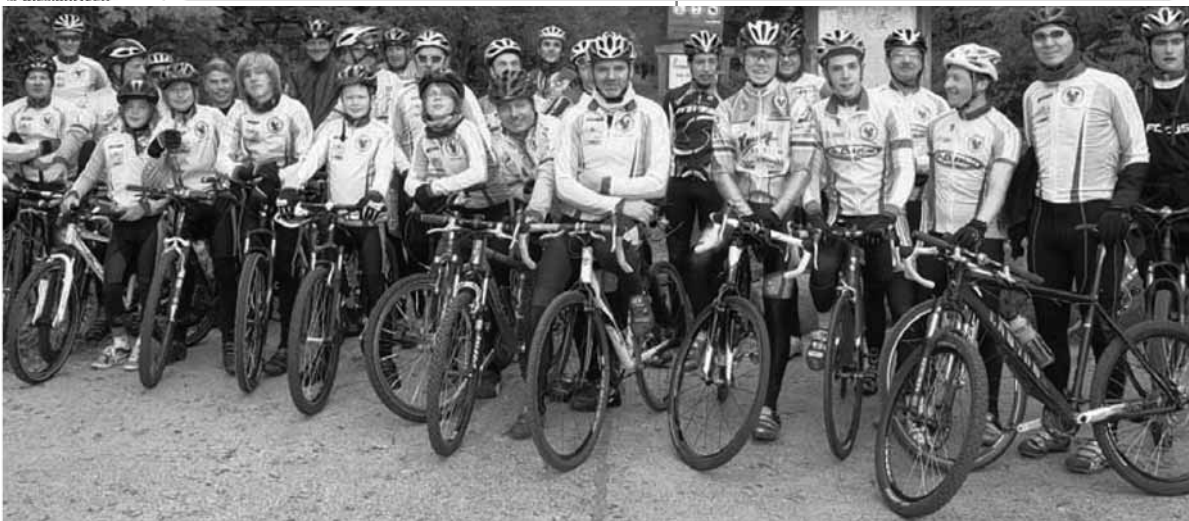
Große Altersunterschiede. Bei den Zehlendorfer Radrennfahrern trainieren Jung und Alt.

„Heute sind wir richtig froh, dass unsere Nachbarin auf das La“